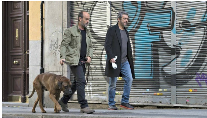
Javier Cámara i Ricardo Darín a "Truman", de Cesc Gay

El Festival Espagnol de Nantes ha presentat el programa de la vint-i-sisena edició. L'organització ha seleccionat la producció "Truman", que optarà als premis Jules Verne, del públic o del públic jove.