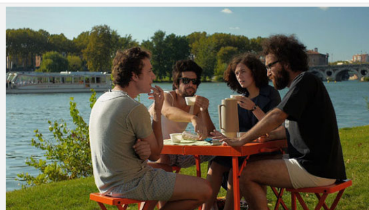
Fotograma de ‘Los exiliados románticos’, galardonada con el Premio Julio Verne en el Festival de Cine Español de Nantes

La vigesimosexta edición del Festival du Cinéma Espagnol de Nantes celebró ayer su ceremonia de clausura y entrega de galardones, en la que la película de Jonás Trueba se llevó el Premio Julio Verne, mientras que Amama , de Asier Altuna, se hizo con el Premio del Jurado Joven 2015.