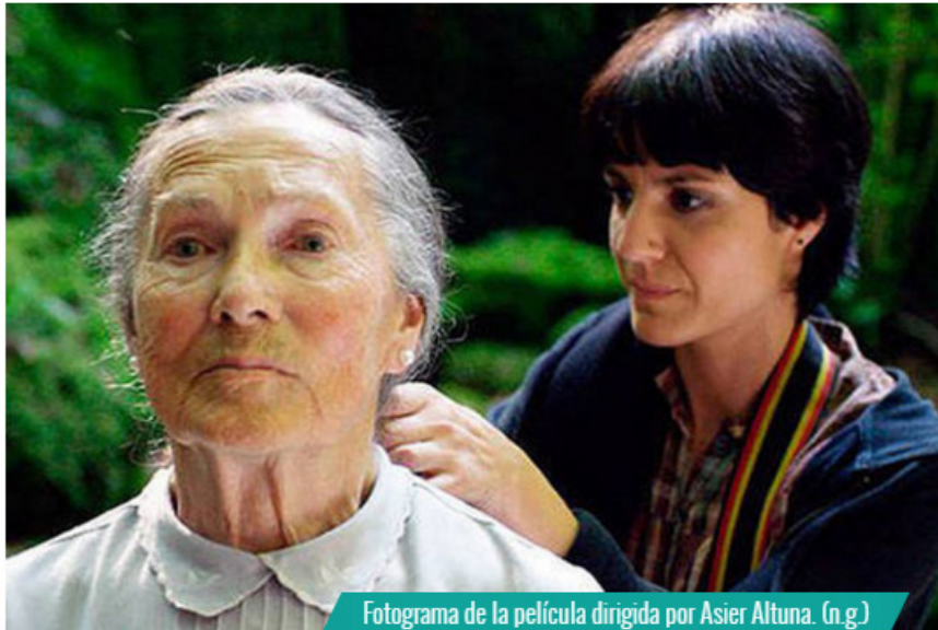
Fotograma de la película dirigida por Asier Altuna. (n.g.)

Amama , la película del director vasco Asier Altuna se ha alzado con el premio del Jurado Joven en la vigésimo sexta edición del Festival de Cine Español de Nantes (Francia).