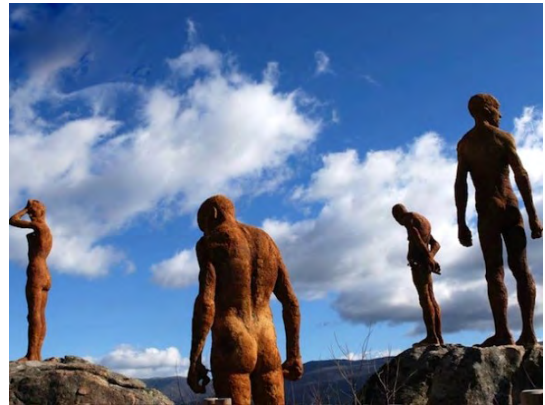
2. Monumento "El mirador de la memoria", del artista Francisco de Cadenilla, inaugurado en 2009 en el Torno