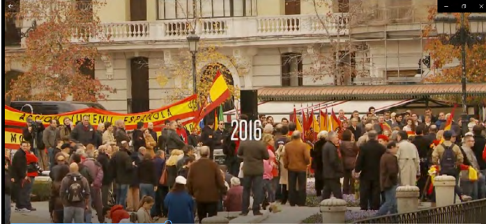
1. 20 de noviembre de 2016, aniversario de la muerte del general Franco

Comenta los fotogramas y explica en qué medida cada uno de ellos pone de relieve la existencia de conflictos de memoria en la sociedad española.