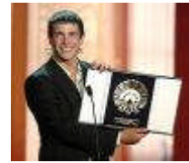
Juan José Ballesta

A los 8 años comienza su carrera en la televisión, hace parte de "Querido Maestro", y de otras series televisivas como " famosos y compañía " y " compañeros ", en el año 2000 fue premiado con uno de los galardones más importantes del cine español: El premio Goya al mejor actor revelación por su papel en la película "EL BOLA", y con el premio Concha de Plata en el festival de San Sebastián en el 2005, por su interpretación en 7 vírgenes.