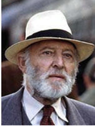
Álvaro de Luna

Nació en Madrid en el año de 1935. Se inicia ante las cámaras como especialista hasta que debuta con un breve cometido de actor en “ La Máscara De Scaramouche ” de Isasi Isasmendi, 1963 en los años sesenta interviene en calidad de figura secundaria en numerosos “ spaguetti – westerns ” y coproducciones hispano-italianas, buena parte de ellas firmadas por Sergio Corbucci. En la década siguiente intenta cambiar de registro y participa en diferentes comedias. Pero no alcanzará la popularidad hasta mediados de los años setenta, cuando se le identifique con el personaje de Curro Jiménez . En la década siguiente empieza a intervenir en otro tipo de producciones y realiza sus mejores trabajos.