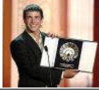
Juan José Ballesta

A los 8 años comienza su carrera en la televisión, hace parte de “ Querido Maestro ”, y de otras series televisivas como “ Famosos y compañía ” y “ compañeros ”, en el año 2000 fue premiado con uno de los galardones más importantes del cine español: El premio Goya al mejor actor revelación por su papel en la película “ El Bola ”, y con el premio Concha de Plata en el festival de San Sebastián en el 2005, por su interpretación en 7 vírgenes.