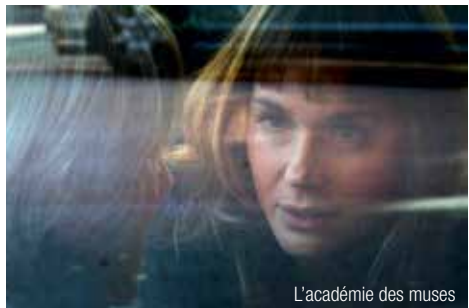
L'académie des muses

Sam 19 – 22h00 Sam 26 – 22h30 Lun 28 – 18h20