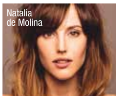
Natalia de Molina