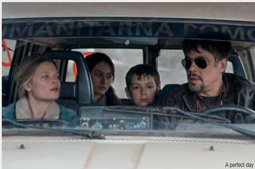
A perfect day

SO Section Officielle OP Opera Prima DOC Documentaire CG Cycle Guerre FLA Hommage Fernando León de Aranoa EA Elena Anaya FB Fenêtre Basque PAN Panorama Séances avec invités Rencontres