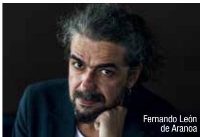
Fernando León de Aranoa