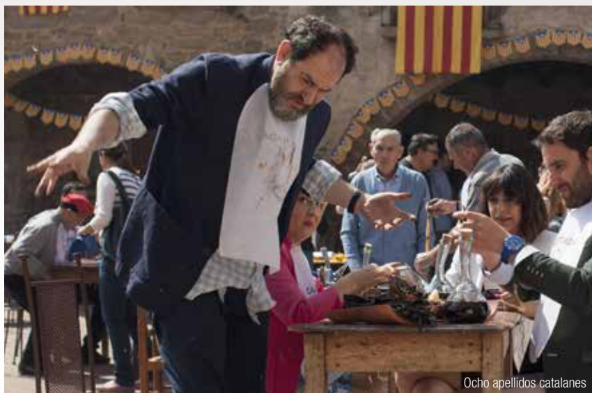
Ocho apellidos catalanes

SO Section Officielle OP Opera Prima DOC Documentaire CG Cycle Guerre FLA Hommage Fernando León de Aiarúa EA Elena Anaya FB Fenêtre Basque PAN Panorama Séances avec invités Rencontres