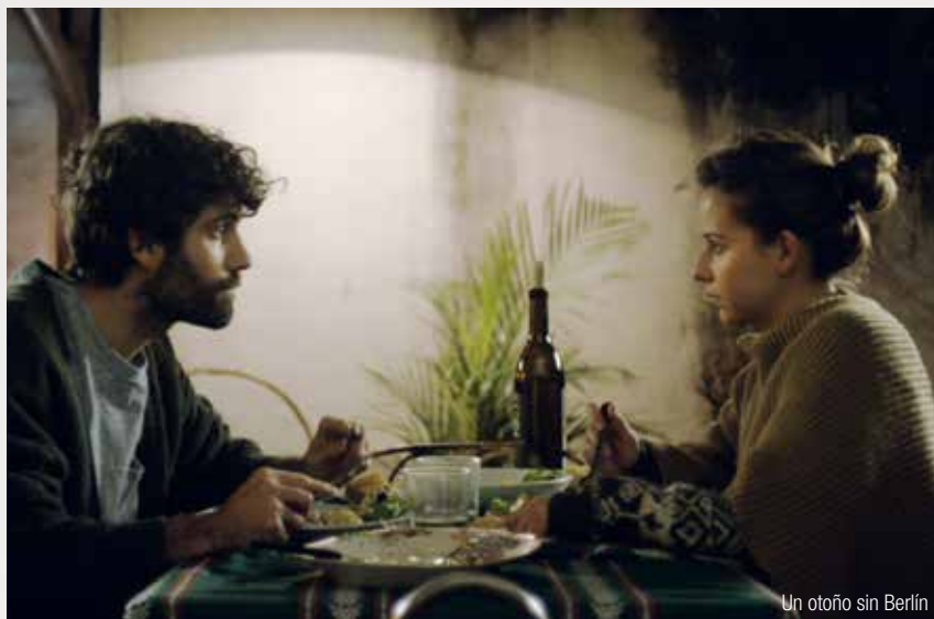
Un otoño sin Berlín

SO Section Officielle OP Opera Prima DOC Documentaire CG Cycle Guerre FLA Hommage Fernando León de Arriba EA Elena Anaya FB Fenêtre Basque PAN Panorama Séances avec invités Rencontres