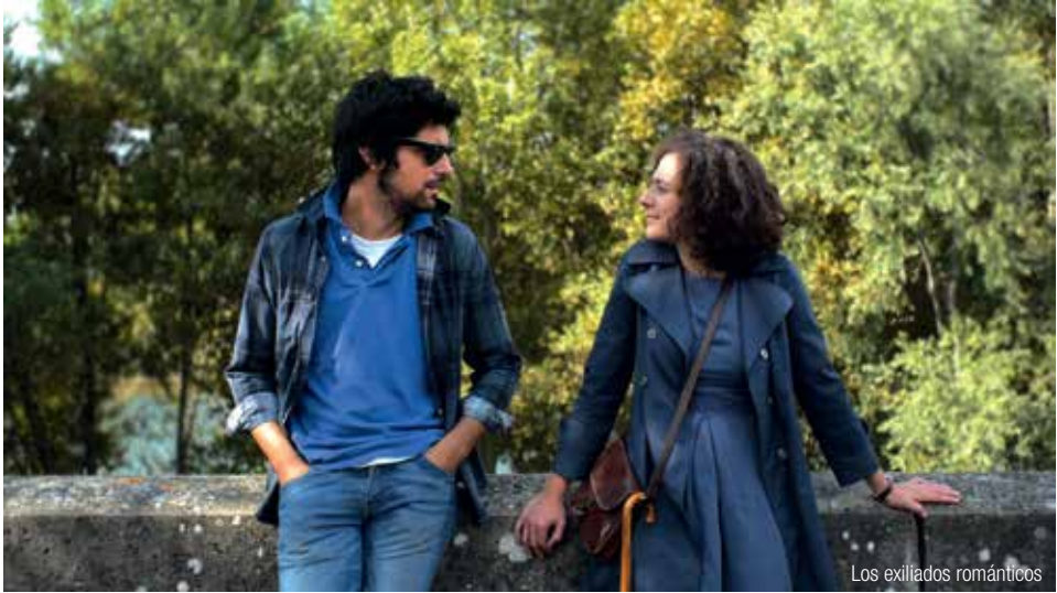
Los exiliados románticos