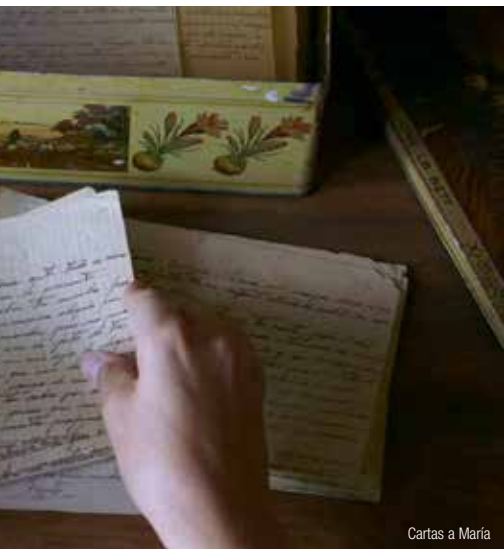
Cartas a María

du traumatisme de la guerre civile pour beaucoup de familles. Le documentaire, Les chemins de la mémoire (2009) de José Luis Peñafuerte, montre comment l'on peut procéder, à la suite du vote de la Loi sur la Mémoire Historique, à des fouilles dans des fosses communes dont les parents des victimes n'avaient même pas pu s'approcher à l'époque de la dictature. Jorge Semprún, témoin d'exception, rappelle qu'il y a encore beaucoup à faire pour que dans l'Espagne actuelle cesse enfin « la domination de la mémoire des vainqueurs ». Benito Zambrano, quant à lui, évoque dans La voz dormida (2011), l'extrême violence qu'avaient subie les femmes incarcérées après la guerre et le drame des « enfants de rouges » en péril d'être abandonnés ou adoptés par des familles bien-pensantes. Enfin Cartas a María (2015), documentaire de Maite García Ribot, montre que ce sont maintenant les petits enfants qui sentent parfois la nécessité d'enquêter sur leur passé pour essayer de renouer les fils de l'histoire familiale qui leur a été occultée.