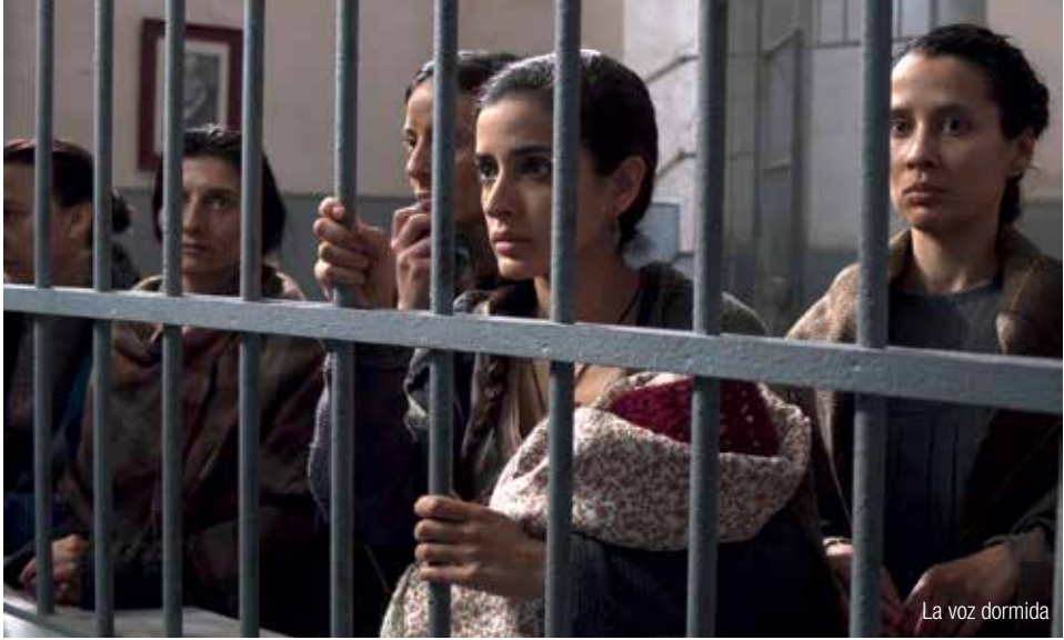
La voz dormida

EN COLLABORATION AVEC LE CONSEIL RÉGIONAL DES PAYS DE LA LOIRE, LE DÉPARTEMENT DE LOIRE-ATLANTIQUE ET AVEC LE SOUTIEN DU RECTORAT DE NANTES.