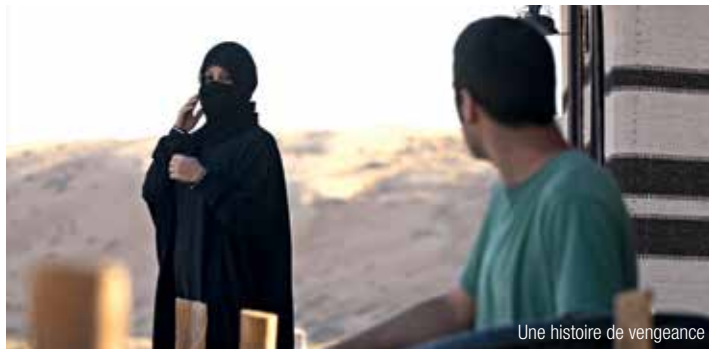
Une histoire de vengeance

Il se rend dans un prestigieux restaurant dont la spécialité est la viande rouge naturelle et de qualité, faible en graisse et en cholestérol.