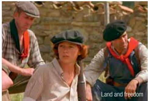
Land and freedom

Les films sont en espagnol sous-titrés en français.