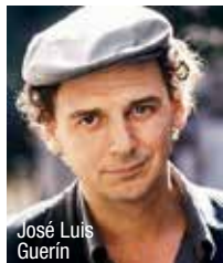
José Luis Guerín