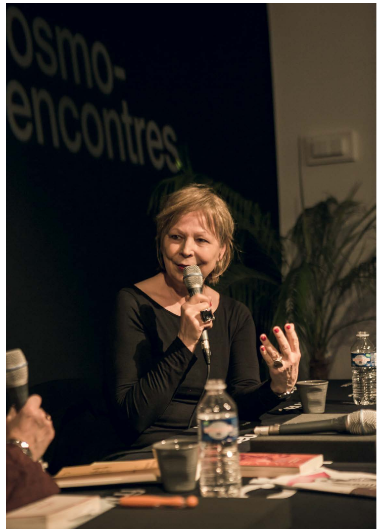
Après un long échange avec le public sur son livre Pas pleurer – pour lequel elle a reçu le Prix Goncourt 2014 – Lydie Salvayre est restée à l'écoute des récits des autres.