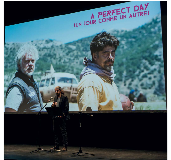
Figure importante du cinéma espagnol actuel, Fernando León de Aranoa a été primé 5 fois aux Goya. Cet hommage a permis, à travers 5 de ses films, de voir comment il dépeint avec humanité et parfois ironie la famille ( Familia ), les adolescents errants ( Barrio ), les prostituées ( Princesas ), les chômeurs ( Les lundis au soleil ) ou le personnel humanitaire d'une zone de guerre dans son dernier film A perfect day .