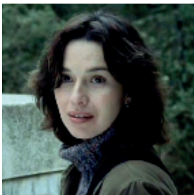
Ariadna Gil (Lola)

Vivir es fácil con los ojos cerrados (2013)