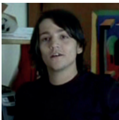
Diego Luna (Gastón)