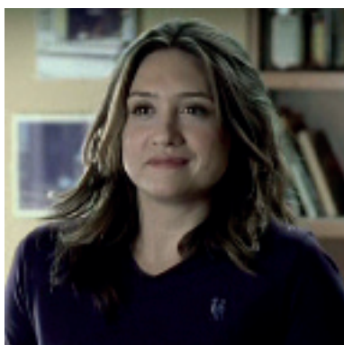
María Botto (Conchi)